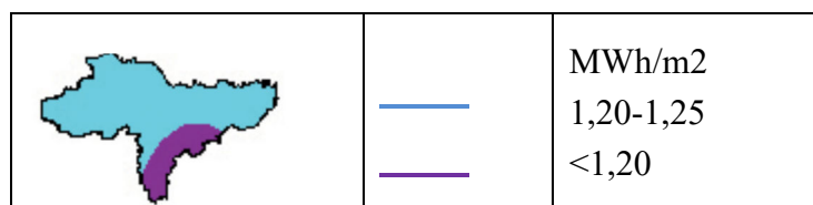
Karta srednje godišnje ozračenosti vodoravne plohe na području Varaždinske županije

Godišnja ozračenost vodoravne plohe osnovni je parametar kojim se može procijeniti prirodni potencijal energije Sunca na nekoj lokaciji.