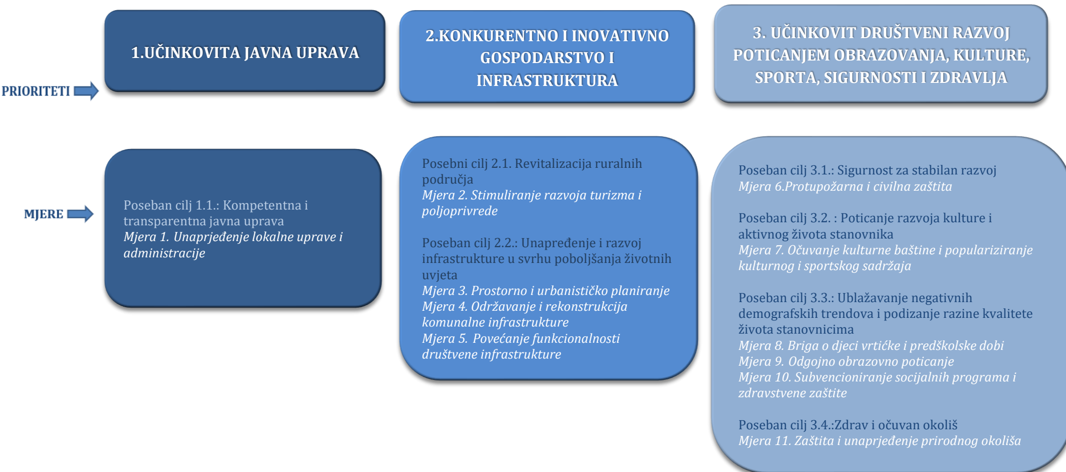
Slika 2. Pregled razvojnih prioriteta i mjera djelovanja u području nadležnosti JLS