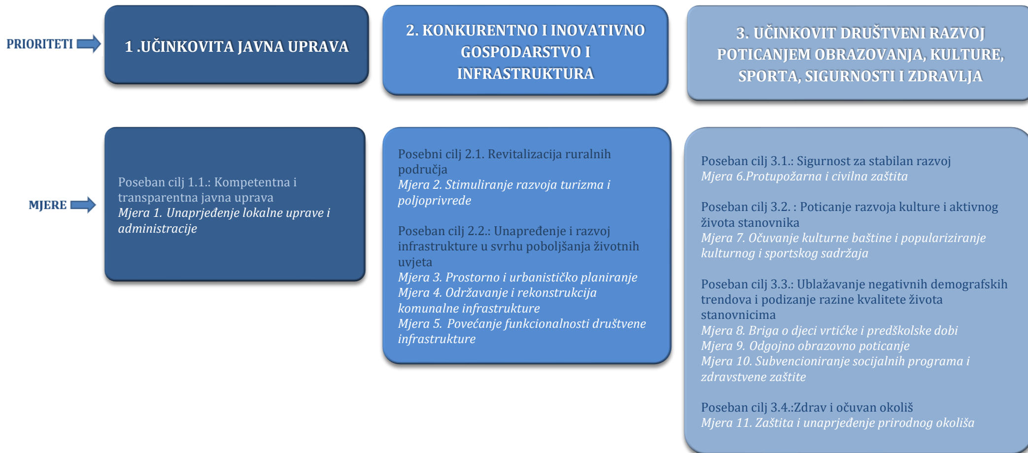
Slika 2. Pregled razvojnih prioriteta i mjera djelovanja u području nadležnosti JLS