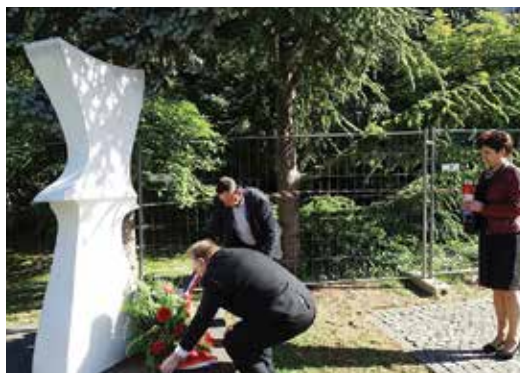
ispunjuju tugom jer više nisu s nama, ali i ponosom zbog svega što su učinili za našu

Hrvatsku – naglasila je Ratković te okupljenima poručila da vole i budu ponosni na našu domovinu, našu Hrvatsku.