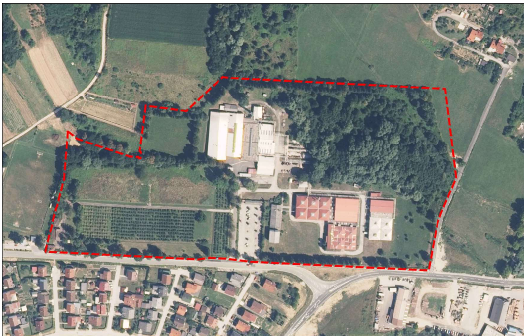
Prikaz 1 Područje obuhvata UPU na ortofoto karti DGU, rujan 2023.

Obuhvat Urbanističkog plana uređenja područja sjeverno od Ludbreške ulice u Varaždinskim Toplicama odnosi se na cca 11,3 ha površine građevinskog područja Grada Varaždinske Toplice, k.č. 4322/1 k.o. Varaždinske Toplice, te zgrade i druge građevine koje se na zasebnim katastarskim česticama nalaze unutar vanjskih granica k.č. 4322/1 k.o. Varaždinske Toplice.